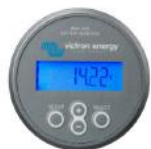
Batterimonitor Måler forbruk og gjenværende driftstid