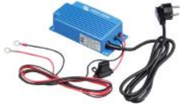
Blue Power Charger 24V 3A IP65