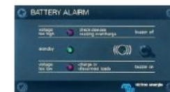
Batteri alarm Gir lyd og lys signal Når batteri spenningen blir ødeleggende