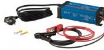
Blue Power Battery Charger IP20 12/15