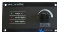
Skylla control Her kan du se systemets status og stille inn maks strøm slik at sikringene på 220 volt siden ikke ryker